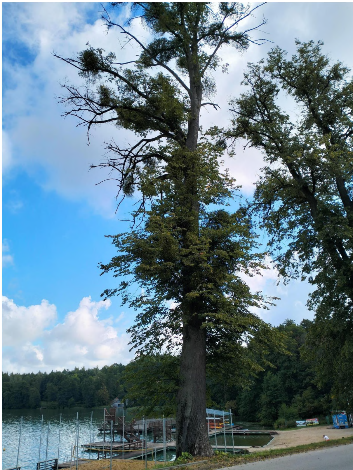
drzewo nr 2