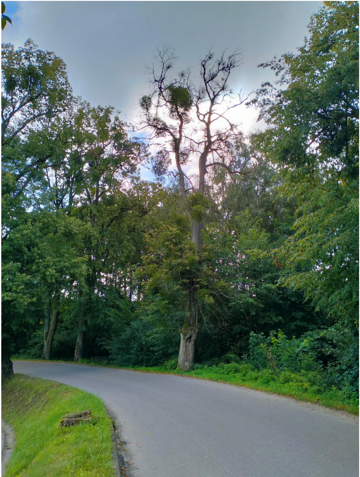
drzewo nr 8