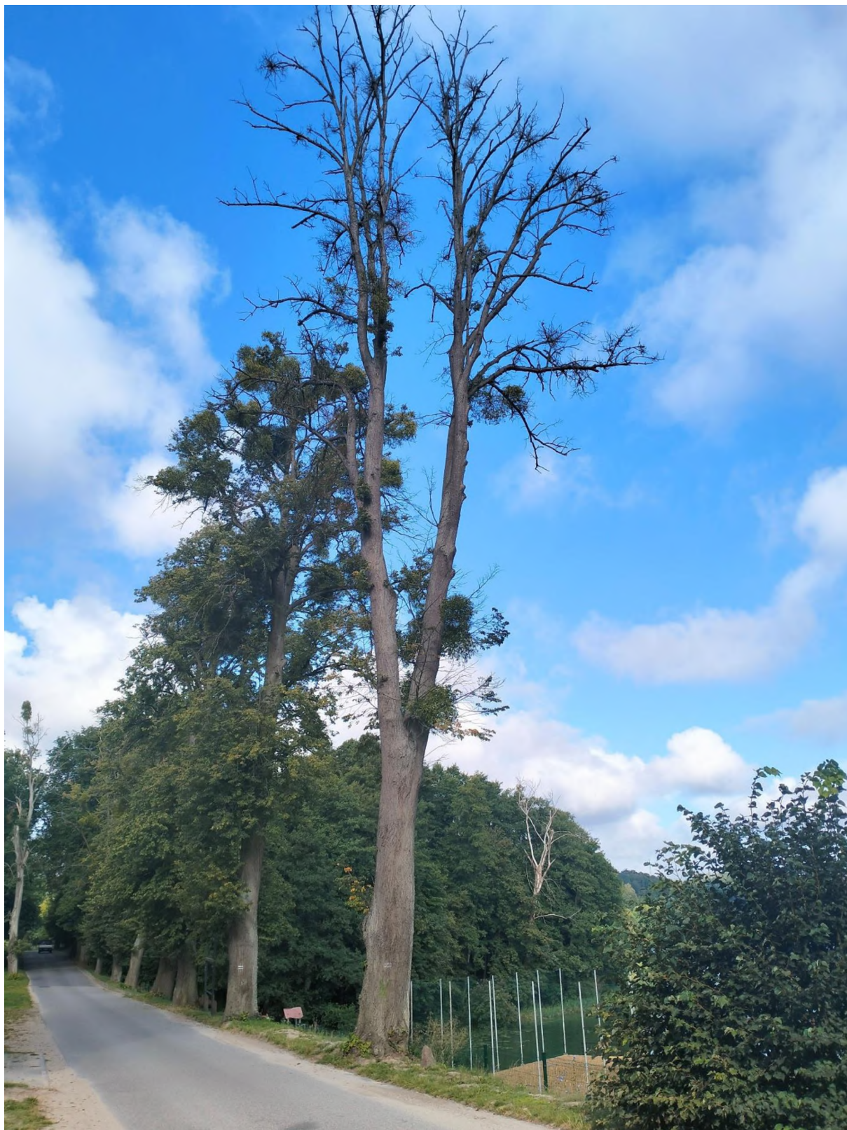
drzewo nr 1