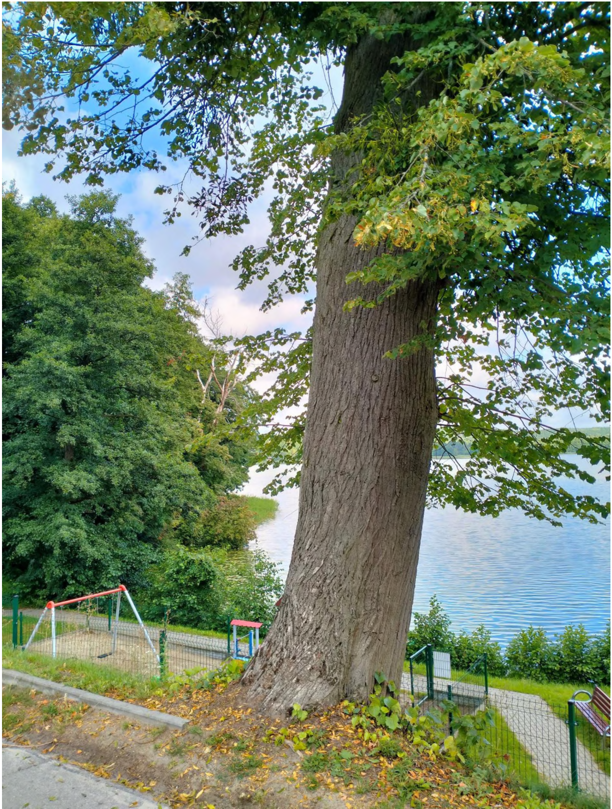
drzewo nr 2